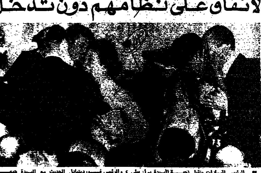
الرئيس السادات يتقبل لائحة السيدات ليل يلى والرئيس فورديبال الحديث مع السيدة جيهان السادات خلال حفلة الضيافة التي اقيمت في ابيت ابيي ترحيباً بالرئيس المصري